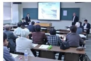
【研究発表大会分科会の様子】

なお、発表者の選考にあたっては、当学会で定める基準に 基づき選考の上、決定します。