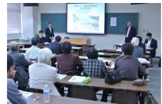
【研究発表大会分科会の様子】

なお、発表者の選考にあたっては、当学会で定める基準に 基づき選考の上、決定します。