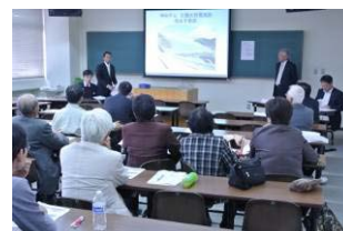
【研究発表大会分科会の様子】

なお、発表者の選考にあたっては、当学会で定める基準に 基づき選考の上、決定します。