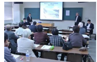
【研究発表大会分科会の様子】

なお、発表者の選考にあたっては、当学会で定める基準に 基づき選考の上、決定します。